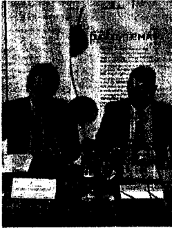
Imagen de la presentación NL

Las conclusiones de este trabajo de cooperación de la red de información y apoyo al emprendedor más importante de la Región de