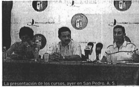
La presentación de los cursos, ayer en San Pedro. A. S.

o informática. Otros cursos, cuyas tarifas van desde los 15 euros a los 200, prevén impartir cursos de español para angloparlantes, informática avanzada, y de monitor de tiempo libre. En enero, se ampliará la oferta educativa. Albaladejo asegura que los cursos han surgido a petición de los vecinos. El proyecto tiene un presupuesto de 36.000 euros. ALEXIA SALAS