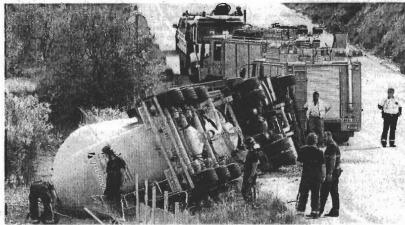
SUSTO. Los bomberos examinan el lugar donde se produjo ayer el incidente.