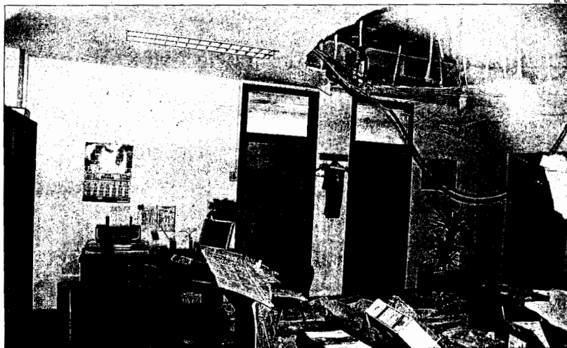
El falso techo que se desprendió causó destrozos en el mobiliario, aunque no provocó daños personales