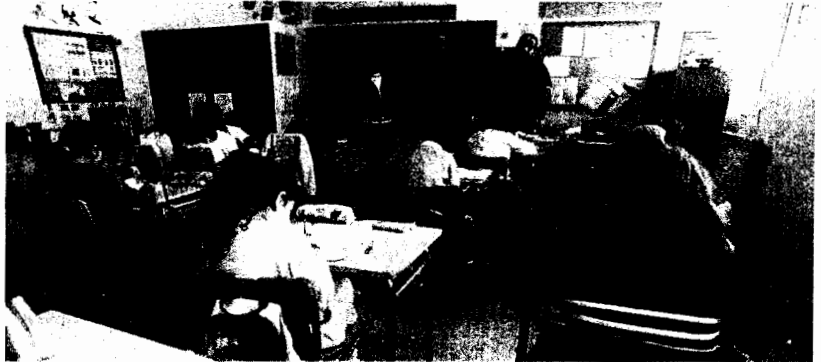
Profesores y personal de Sanidad, ayer, en el colegio Santiago Apóstol de Portmán.

En los últimos años, diferentes estudios -especialmente los del Centro Nacional de Epidemiología- ponen de manifiesto que los ciudadanos de la región tienen más riesgo de padecer cáncer de vejiga, útero y piel que la media nacional. De igual forma, subrayan que los cartageneros y los unionenses tienen tres veces más de probabilidad de desarrollar tumores en la pleura (membrana que rodea los pulmones), colon, recto, leucemia y melanoma, debido a la contaminación atmosférica principalmente.